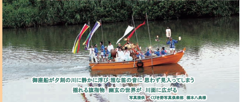
御座船が夕刻の川に静かに浮び 雅な笛の音に 思わず見入ってしまう 揺れる旗指物 幽玄の世界が 川面に広がる