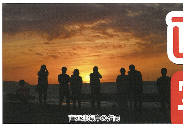
直江津海岸の夕陽